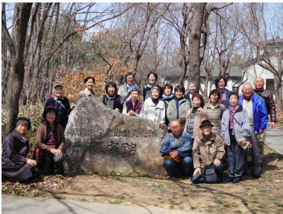
無言館(戦没画学生慰霊美術館) 長野県 上田市

この後 24日は外を見たら真っ白、霜が降りていました。この時期にしては冷たい日でした。