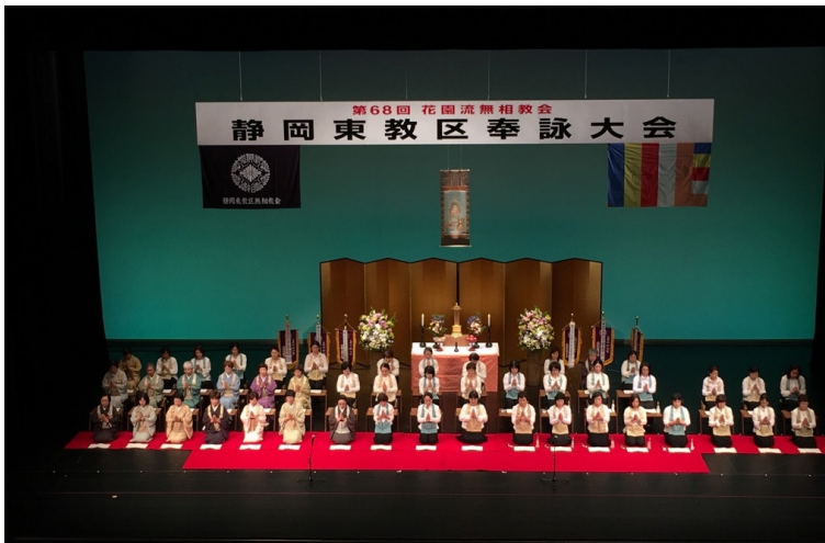
静岡東教区(藤枝～沼津)寺庭 47 名による「花園太上法皇御詠歌 1～4 番」

http://www.at-s.com/sbstv/program/sokoshiri/