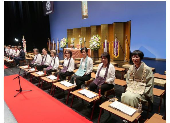
秘在寺支部は「盆施餓鬼御和讃」をお唱えしました。開始直前の様子です