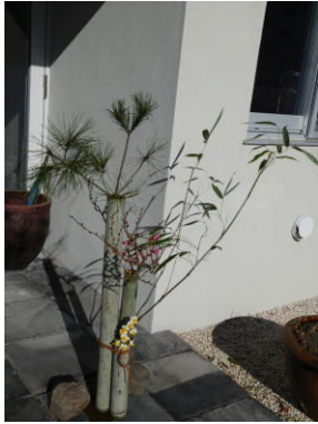
住職手作りの門松です。永代供養墓横の紅梅が年末にはちらほら咲くので使います。

昔、街道筋に一里（四皿）ごとに盛り土をし、旅人の目印としました。傍らに植えた榎（えのき）が夏には多くの葉を繁らせ、旅人の疲れを癒したことでしよう。 この「秘在寺だより」をお読みいただいている檀信徒の皆さん、それぞれどのようなお正月を迎えられましたか。何はともあれ、お陰さまで今年も正月を迎える事が出来ました。お互い今日この今、生かされていくことに感謝し、日々を大事に大切に過ごすことをこの新年に誓いましょう