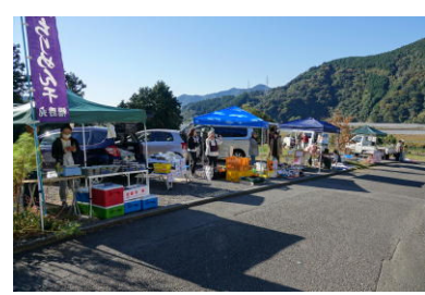
本堂前にはたくさんのお店が

毎年九十本ほど作るのですが、茶席で使 ったので、販売用が少なくなりました。 一昨年から国際ことば学院に案内を差 し上げていますが、今回は台湾とスリラ ンカの学生さんが来てくれました。どち からも仏教国の方なので、法要に興味を引 かれたようです。