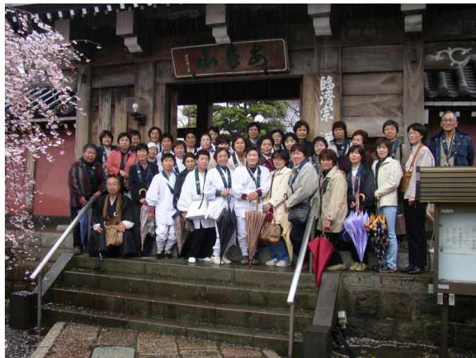
平成 18 年 4 月 三十二番札所 沼津 蓮光寺

秘在寺のお参りの旅は平成十七年、駿河一國参りから始まりました。あれからもう十三年経とうとし、当時の参加者の中で鬼籍に入られた方もいらっしゃると思います。写真を見ては懐かしく思い出します。前回の一國参りはお勤めの方も参加できるように、日曜日、日帰りで実施しました。そろそろもう一回企画しようかと考えております。皆様、どうでしょうか？気軽な日帰りのお参りをしてみませんか？