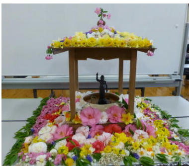
昨年の花御堂です

昨年に引き続き「安倍ごころ」にて花まつりをします。御詠歌泉会会員が生花を集めて飾った花御堂に是非お参りください。抹茶とお菓子もご用意します。お子様にも見せてあげてください。