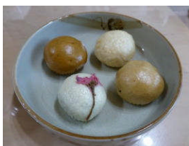
さくら・黒糖・酒・しょうゆまんじゅう