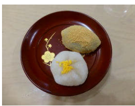
うぐいす餅・白梅